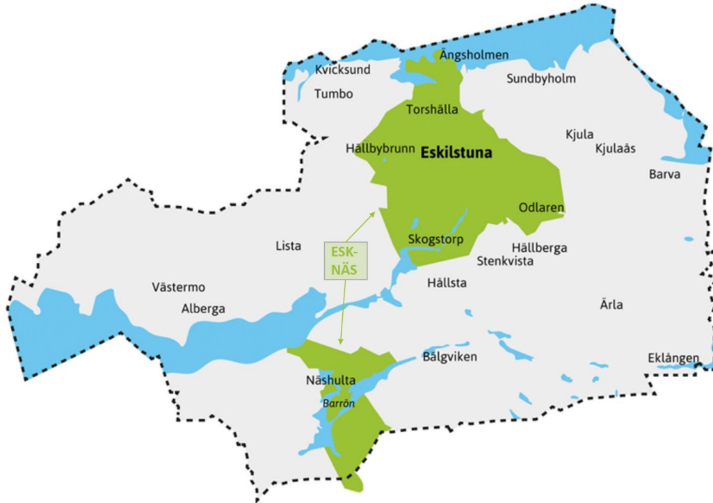
Figur 1. Karta över Eskilstuna kommun och området där EEM Elnät bedriver nätverksamhet samt EEM Elnäts område i nätutvecklingsplanen (ESK-NÄS)